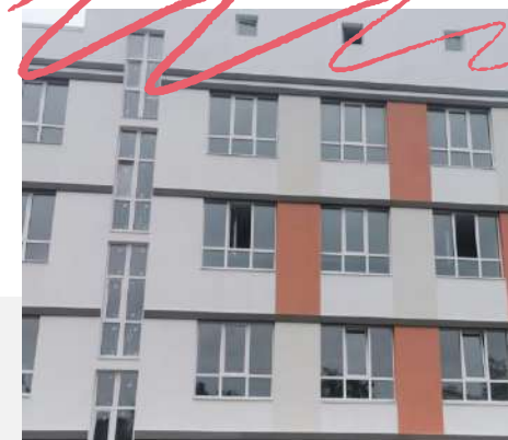
Гімназія № 59