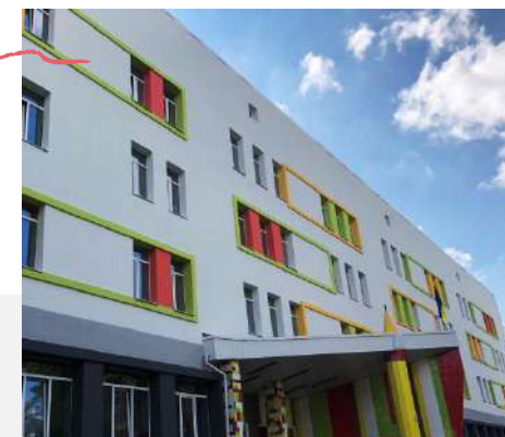
Гімназія № 179