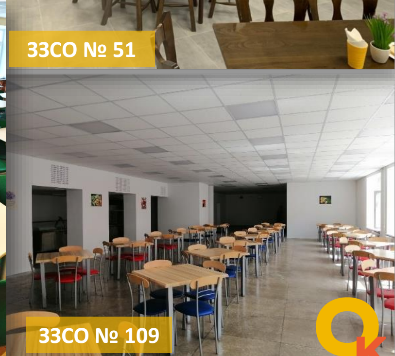
33CO № 109