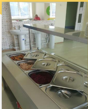
33CO № 173