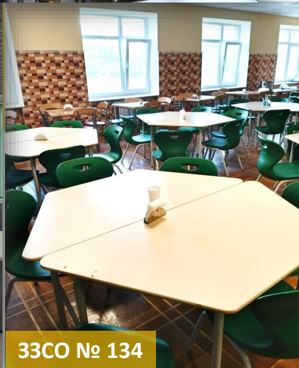
33CO № 134