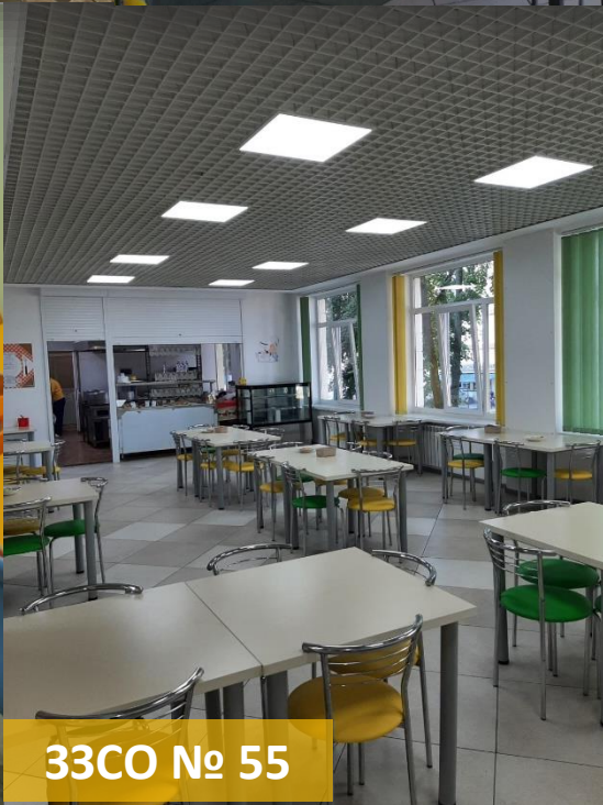
33CO № 55