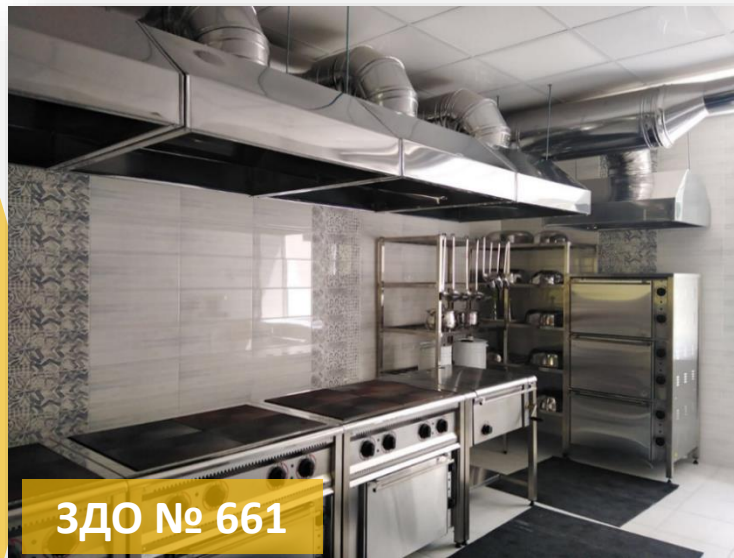
ЗДО № 661