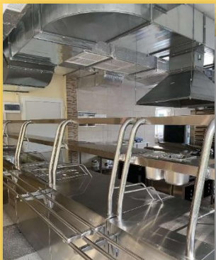
33CO № 284