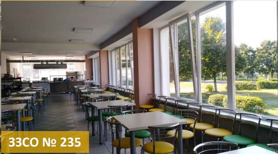
33CO № 235