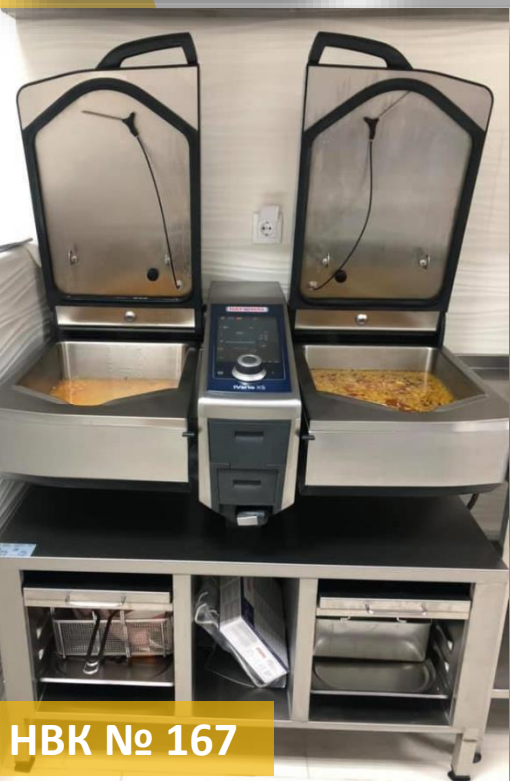
HBK № 167