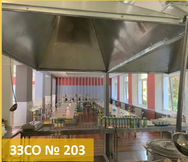
33CO № 203