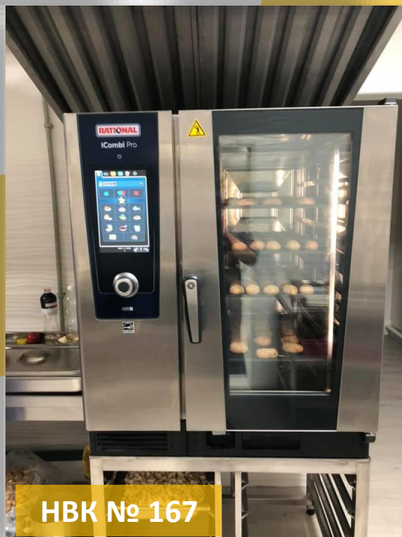
HBK № 167