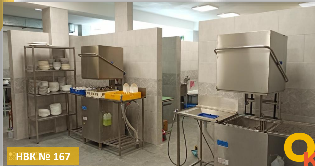
HBK № 167