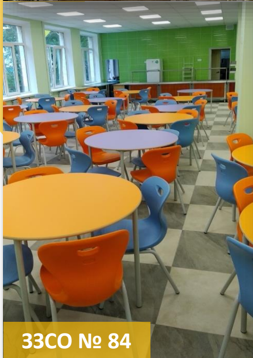
33CO № 84