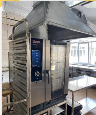
33CO № 284