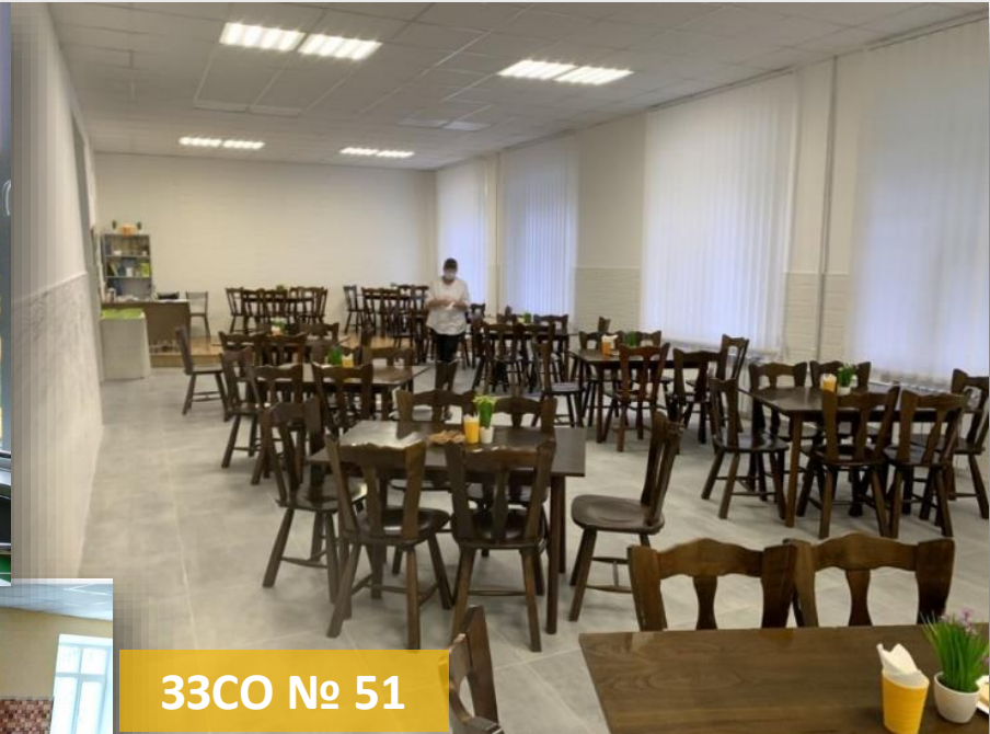
33CO № 51