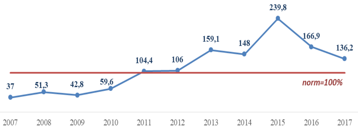
Рисунок 1.1 Рівень забезпечення закладами фахової передвищої, вищої та професійно-технічної освіти попиту на ринку праці м. Києва, %

Попри відсутність кореляції між потребою підприємств у працівниках та пропозицією трудових ресурсів на ринку праці, яка забезпечується, зокрема, закладами освіти м. Києва, аналіз основних показників його формування за останні роки свідчить про зменшення напруженості та диспропорцій між попитом та пропозицією. Так, якщо, починаючи з 2012 року, спостерігалась тенденція із щорічним істотним зростанням кількості безробітних та скороченням вільних вакантних посад на ринку праці (навантаження на вільне робоче місце сягнуло максимальних значень до 4,3 осіб у 2015 році), то в подальші роки співвідношення обсягів зареєстрованого безробіття та потреби підприємств у працівниках на заміщення вільних вакантних посад змінилося в сторону зменшення – до 2,1 осіб зареєстрованих безробітних на 1 вільне робоче місце (вакантну посаду) у 2016 році та 1,4 – у 2017 році.