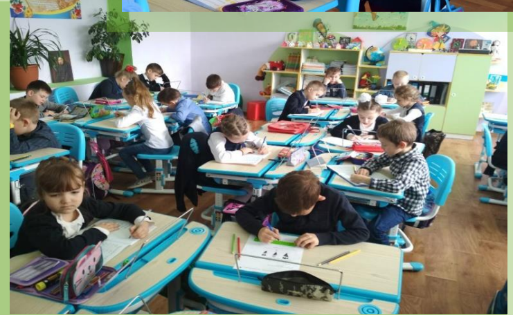
ЗЗСО № 34 Подільський район