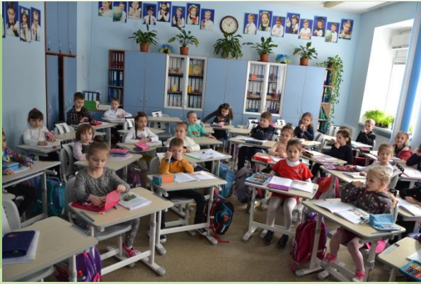
ЗЗСО № 177 Солом`янський район