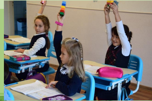
ЗЗСО № Дніпровський район