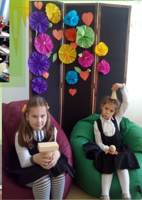
ЗЗСО № 144 Солом`янський район