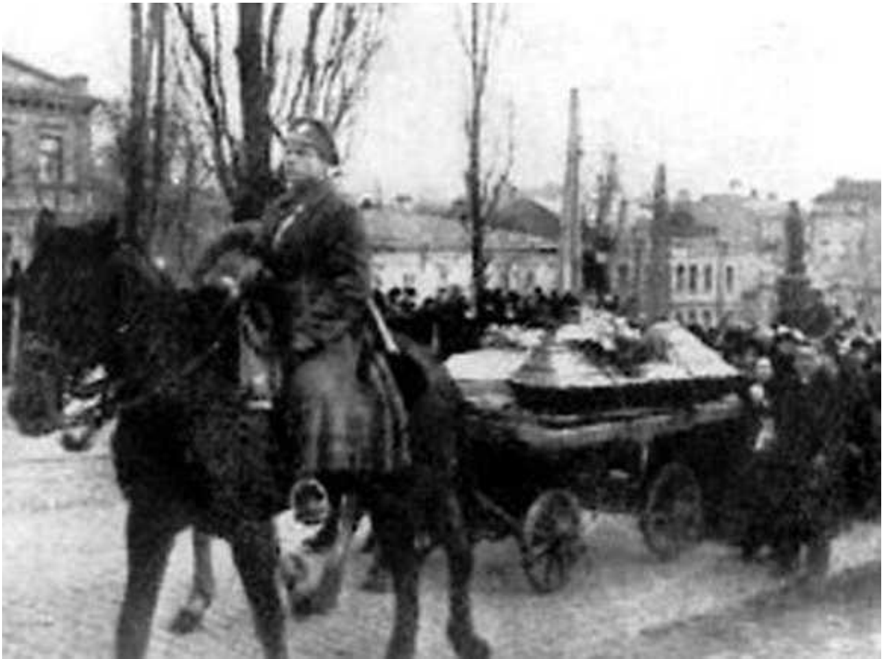
Прощання із загиблими в бою під Крутами

Подвиг студентів-крутян став символом мужності та беззастережної любові до власної Батьківщини. За часів радянської влади, про бій під Крутами забули на довгих 70 років, до отримання Україною незалежності. Тільки в останні роки історики почали активно вивчати наявні матеріали. І хоча зараз виникає більше питань, ніж відповідей, незмінним залишається один факт: битва під Крутами – одна з визначних сторінок історії України, яку ми маємо пам'ятати. [20]