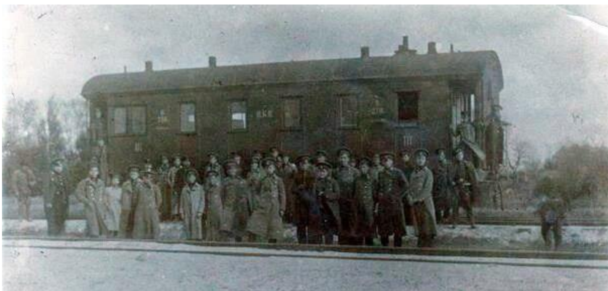
Студенти на станції Крути, фото незадовго до бою

Добровольці почали тренування, які продовжувались не більше тижня, до 26 січня. Звісно, про жодну адекватну військову підготовку не могло йти і мови. У той же день загін підпорядковується Аверкію Гончаренко, переправляється під Бахмач, де разом з чотирма сотнями курсантів 1-ї Київської юнкерської школи імені Богдана Хмельницького має стати на захист Києва.