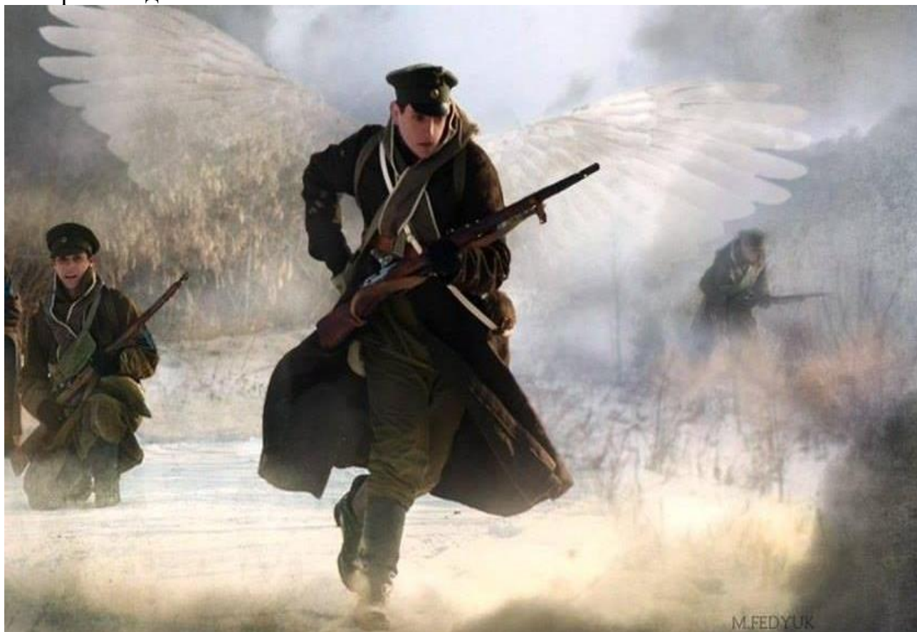
Бій під Крутами, 29 січня 1918 року

Ці рядки український поет Микола Луків присвятив подвигу української молоді – студентам і гімназістам – які 29 січня 1918 року прийняли нерівний бій з більшовицькою навалою біля станції Крути та поклали найдорожче на вівтар свободи – власні життя.