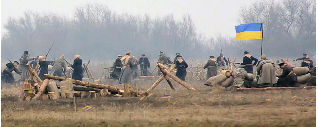
Сучасна реконструкція бою під Крутами