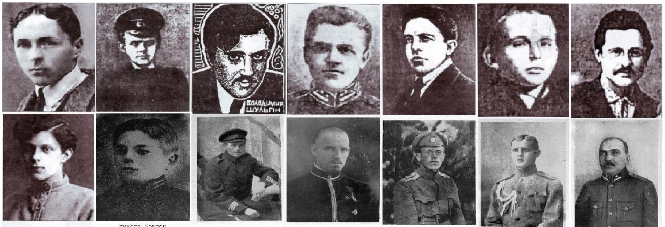
Фото загиблих Героїв Крут