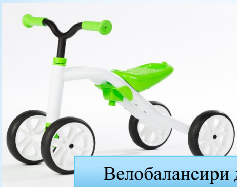
Велобалансири для дітей до 3 років