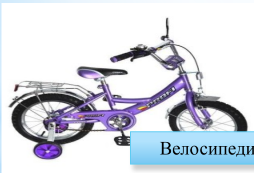
Велосипеди двоколісні дитячі