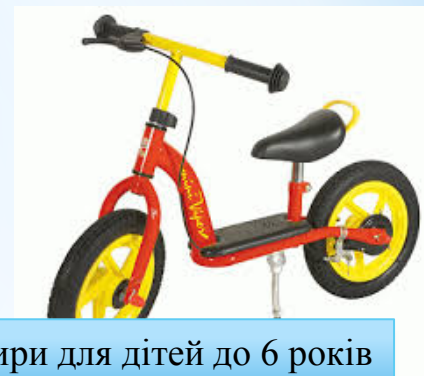
Велобалансири для дітей до 6 років