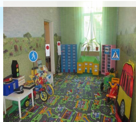
«Кімната для вивчення правил дорожнього руху»