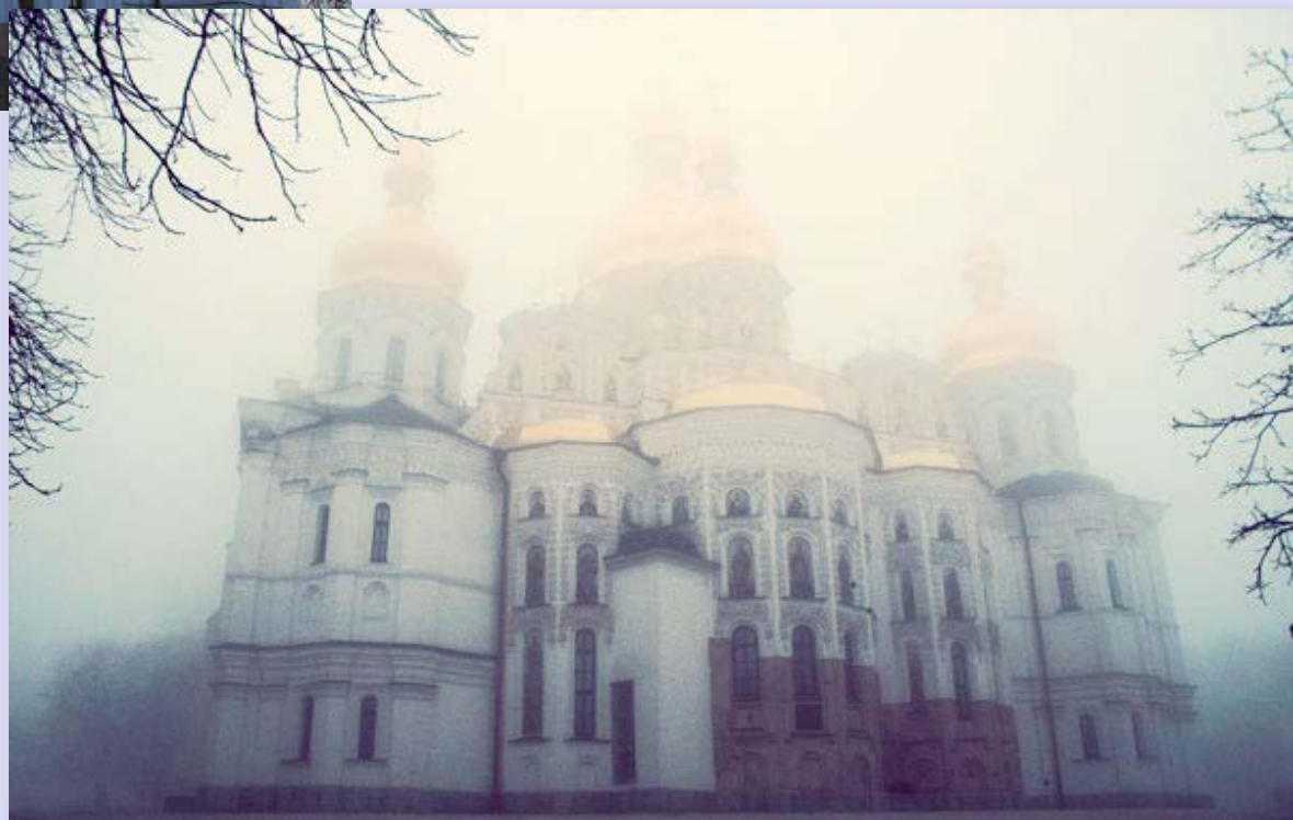
Печерська Лавра в тумані