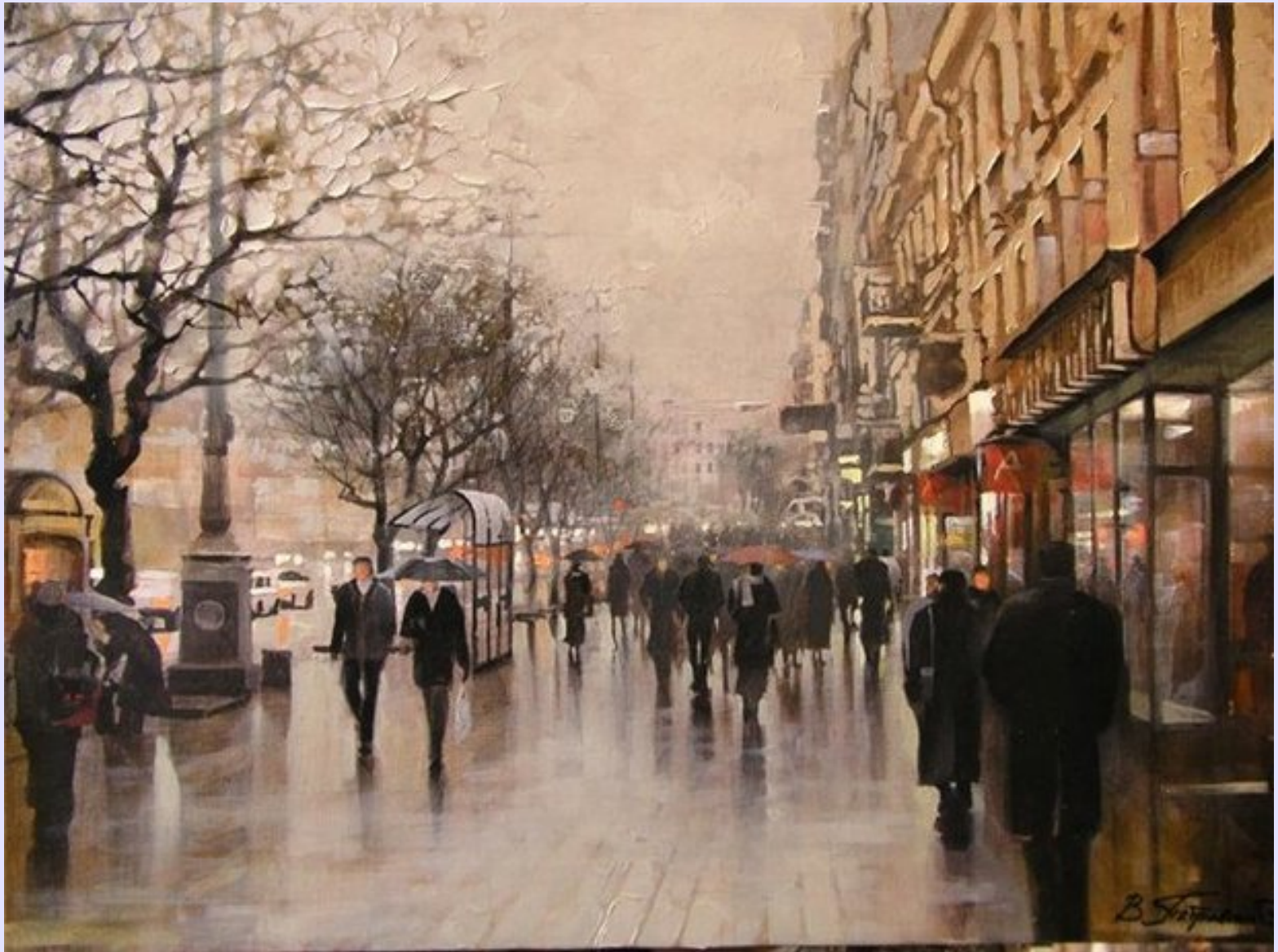
Дощ на Хрещатику