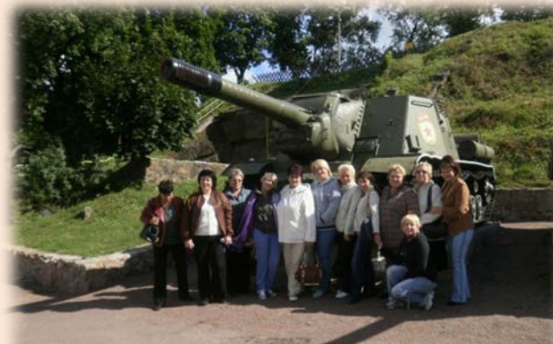
м. Коростень (2012 р.)