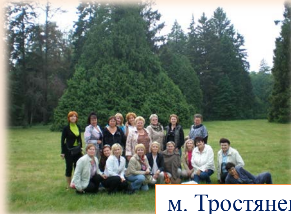
м. Тростянець (2012 р.)