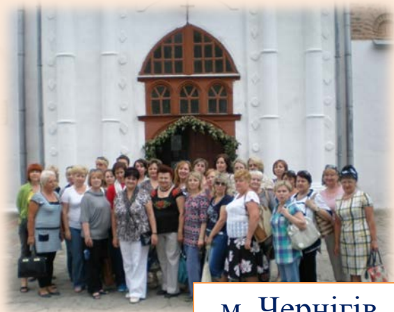
м. Чернігів (2014 р.)