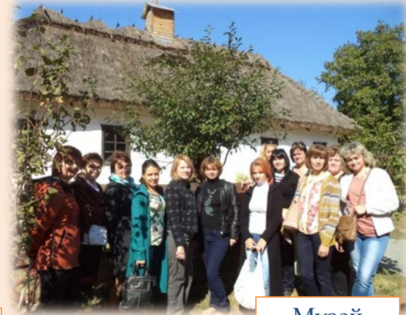
Музей Пирогово (2014 р.)