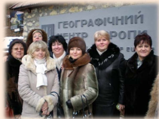
м. Яремче (2013 р.)