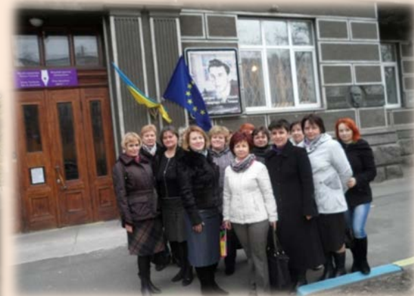
Музей П. Тичини (2015 р.)