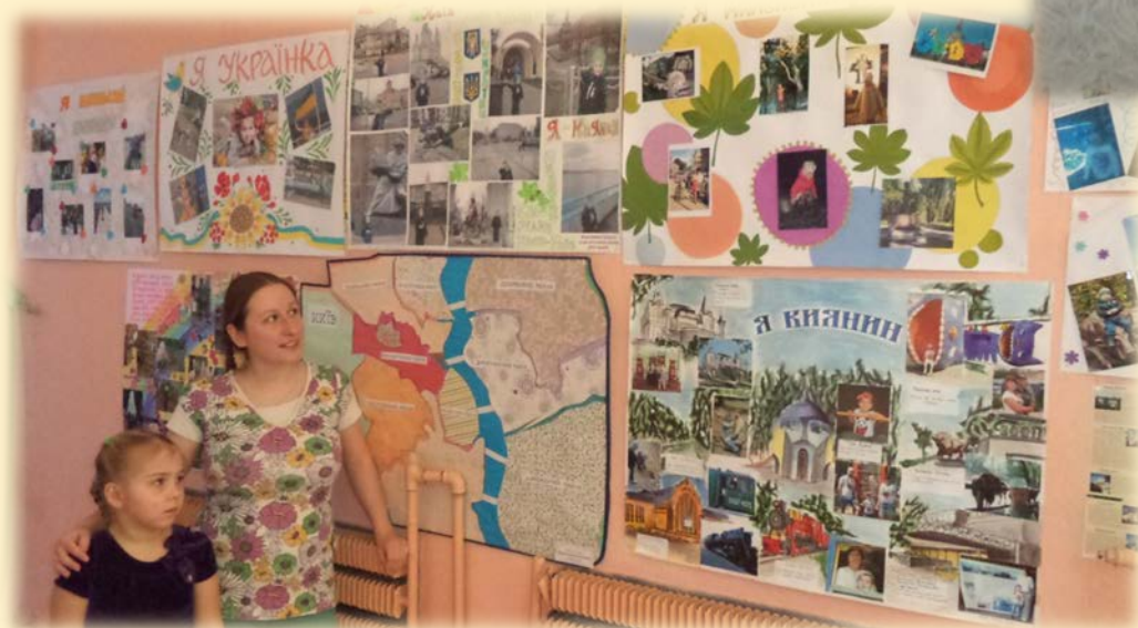
Родинні газети «Маленький киянин»