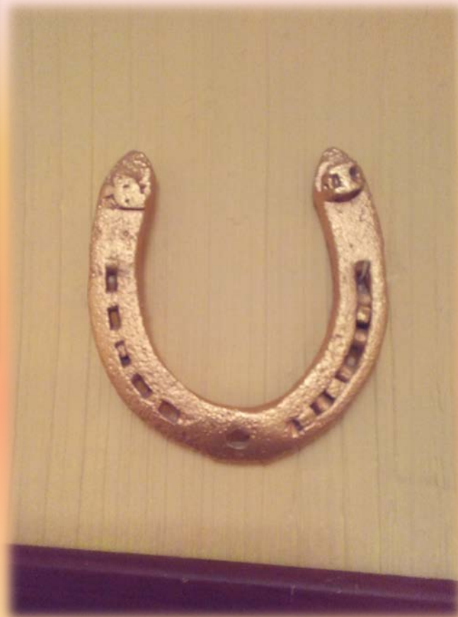
Щаслива підкова прадідуся