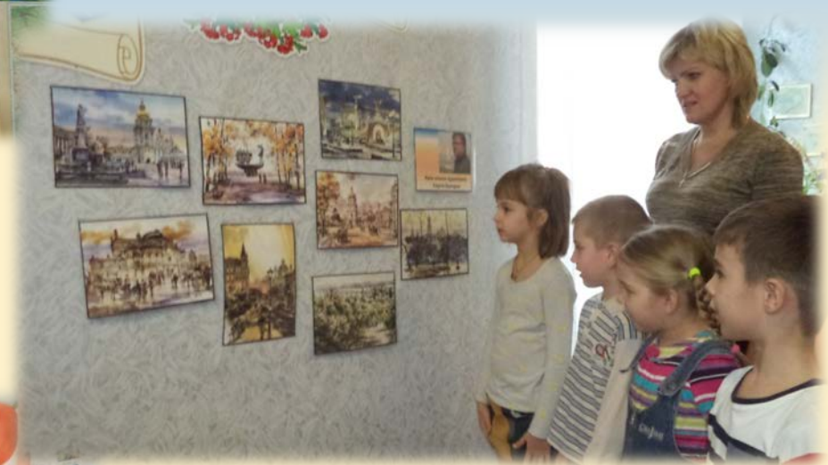
Київ в картинах Сергія Брандта