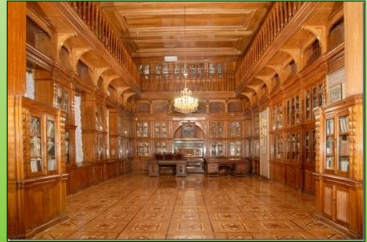
Національний музей літератури України