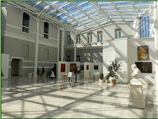
Національний музей Тараса Шевченка