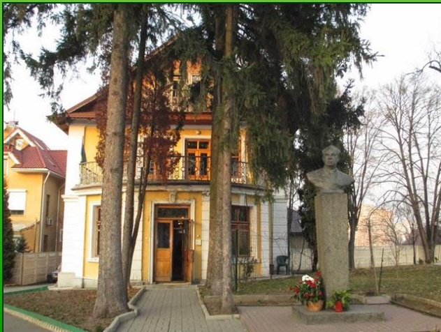
Київський літературно-меморіальний музей Максима Рильського