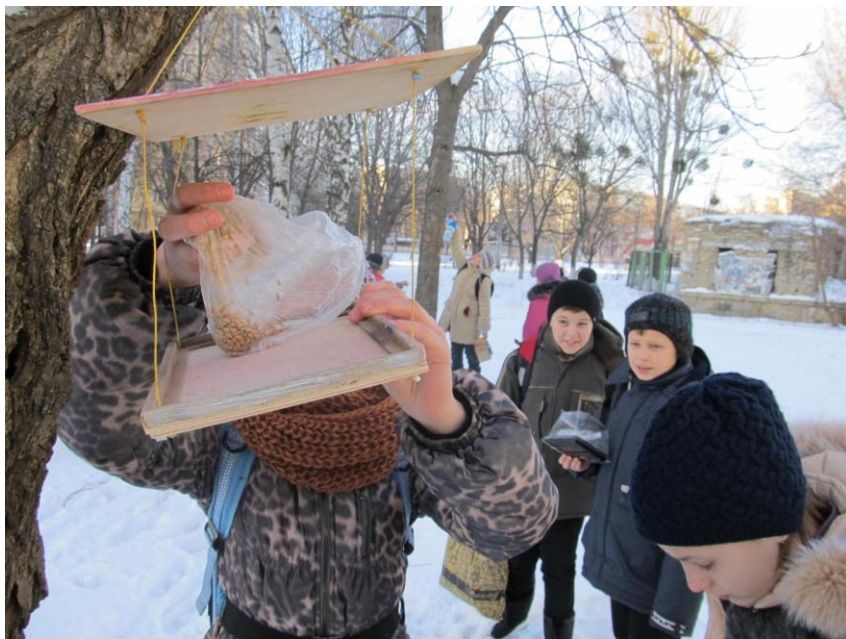
Акція «Подаруй оселю птахам!»