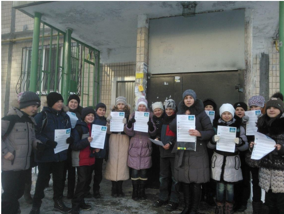
Інформаційна акція «Поради з енергозбереження» для жителів масиву Теремки-2