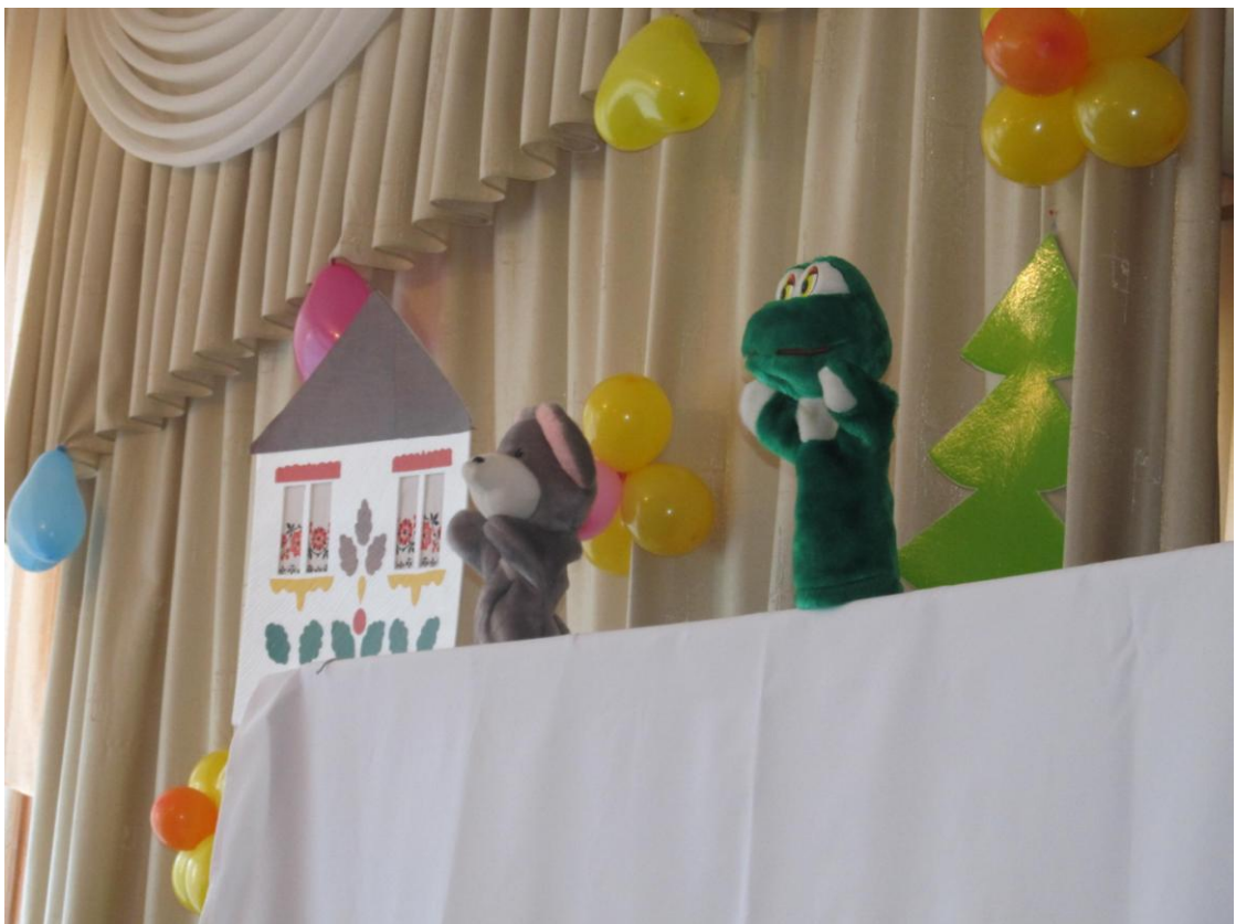
Лялькова вистава «Енергоефективна хатинка» для дітей дитсадочку №150