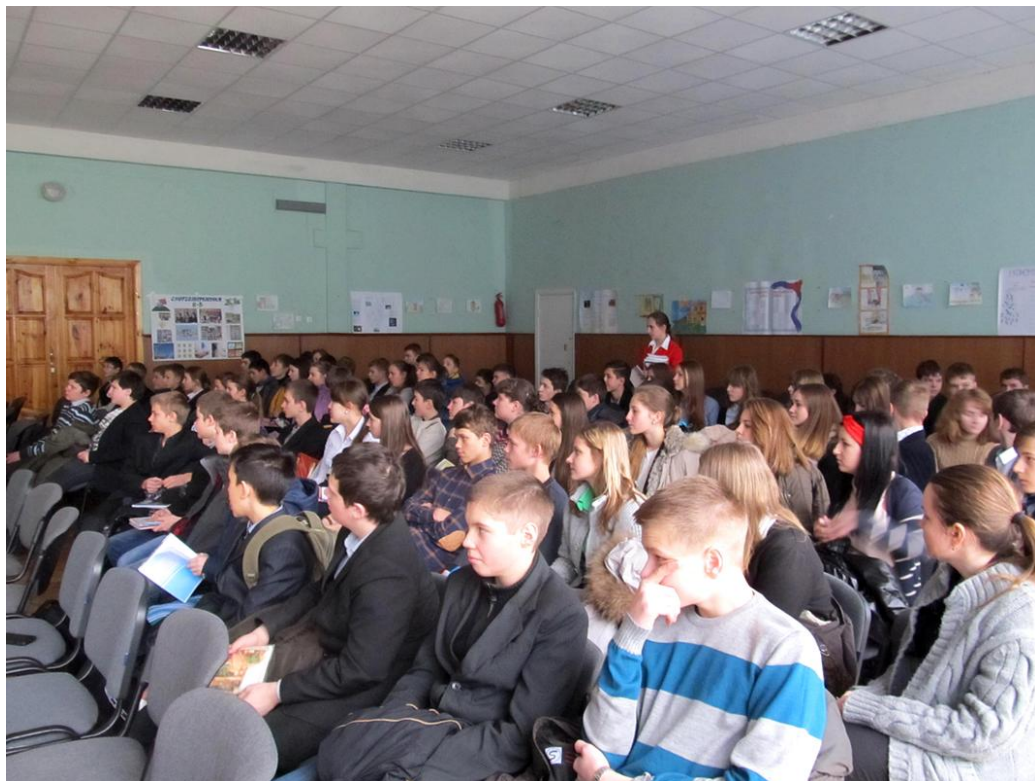
Урок-презентація з «теплого аудиту» для 8 класів