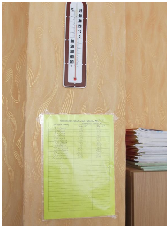
Ведення календарів температурного режиму класів