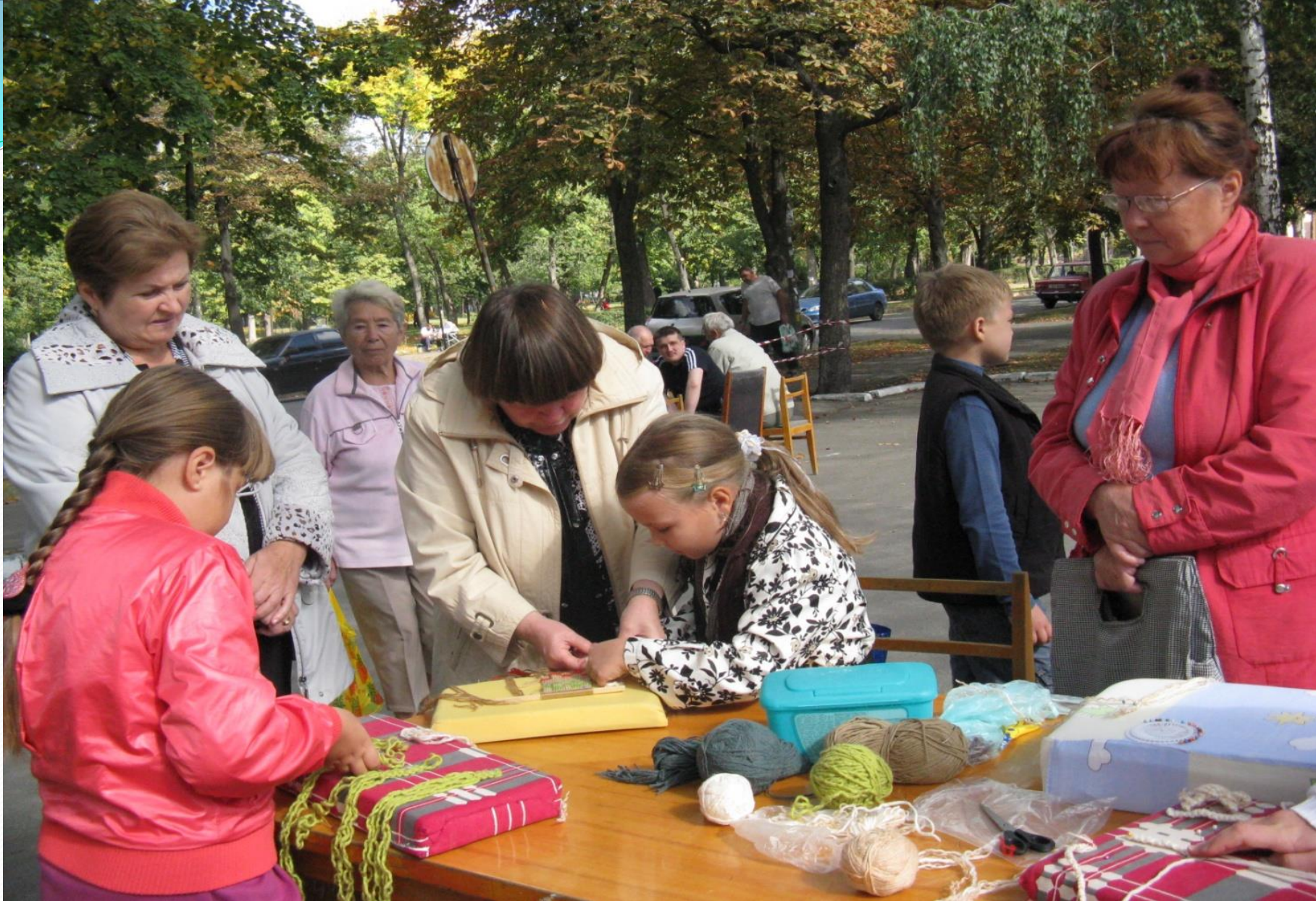
Дитячо-юнацький центр Дарницького району Майстер-класи для мешканців району.